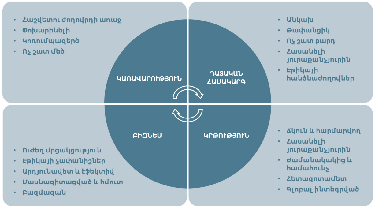
Դիագրամ 1. Էկոհամակարգի չորս հենասյուները 1