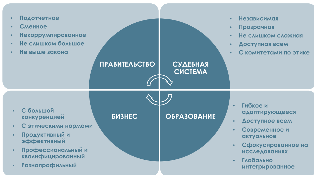
Диаграмма 1: Четыре основных компонента экосистемы 1

Заключение. Сама концепция справедливого общества сложна. Мы обращались к этому вопросу во всех наших отчётах. Ниже мы вновь приводим одну из диаграмм, которые использовали в прошлом. Мы полагаем, что она наиболее релевантна для обсуждения темы справедливого общества.